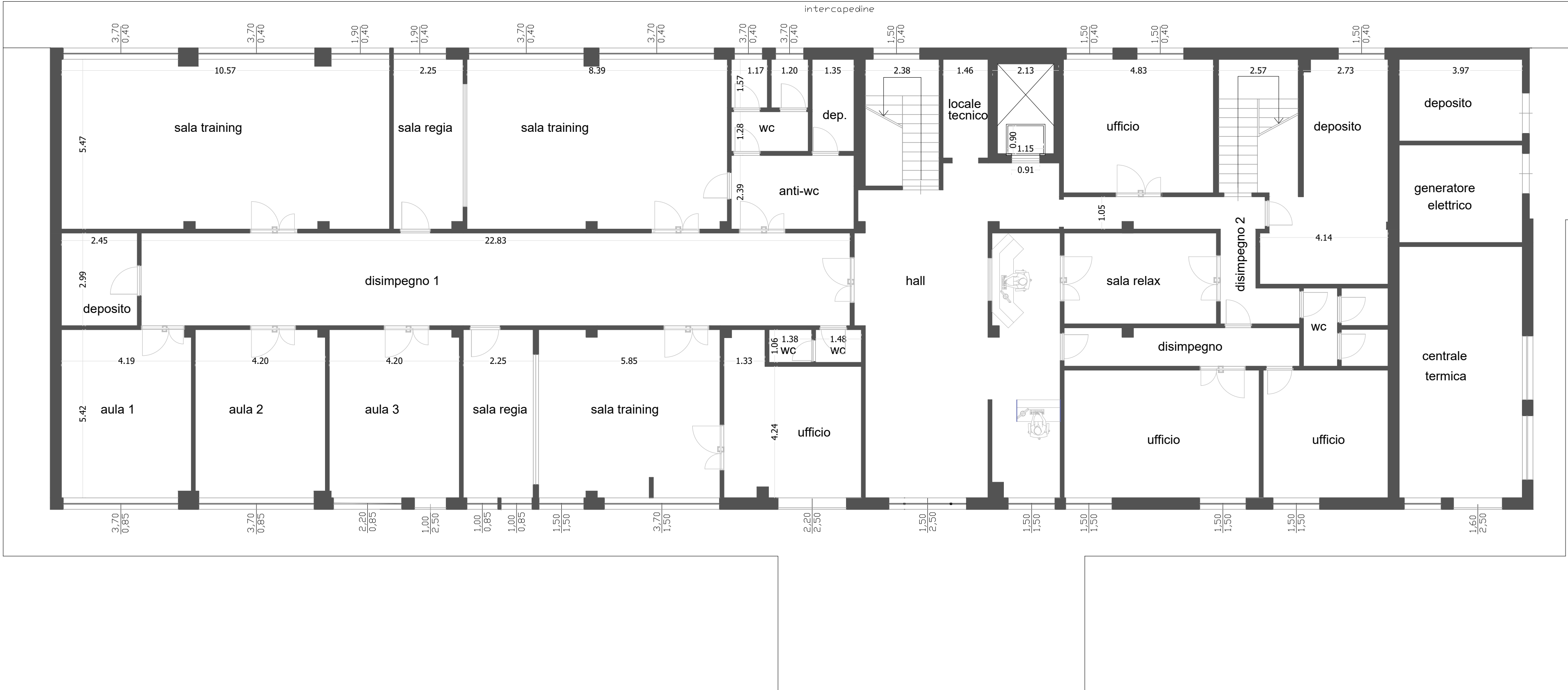
STATO DI FATTO - Piano terra Scala 1:100