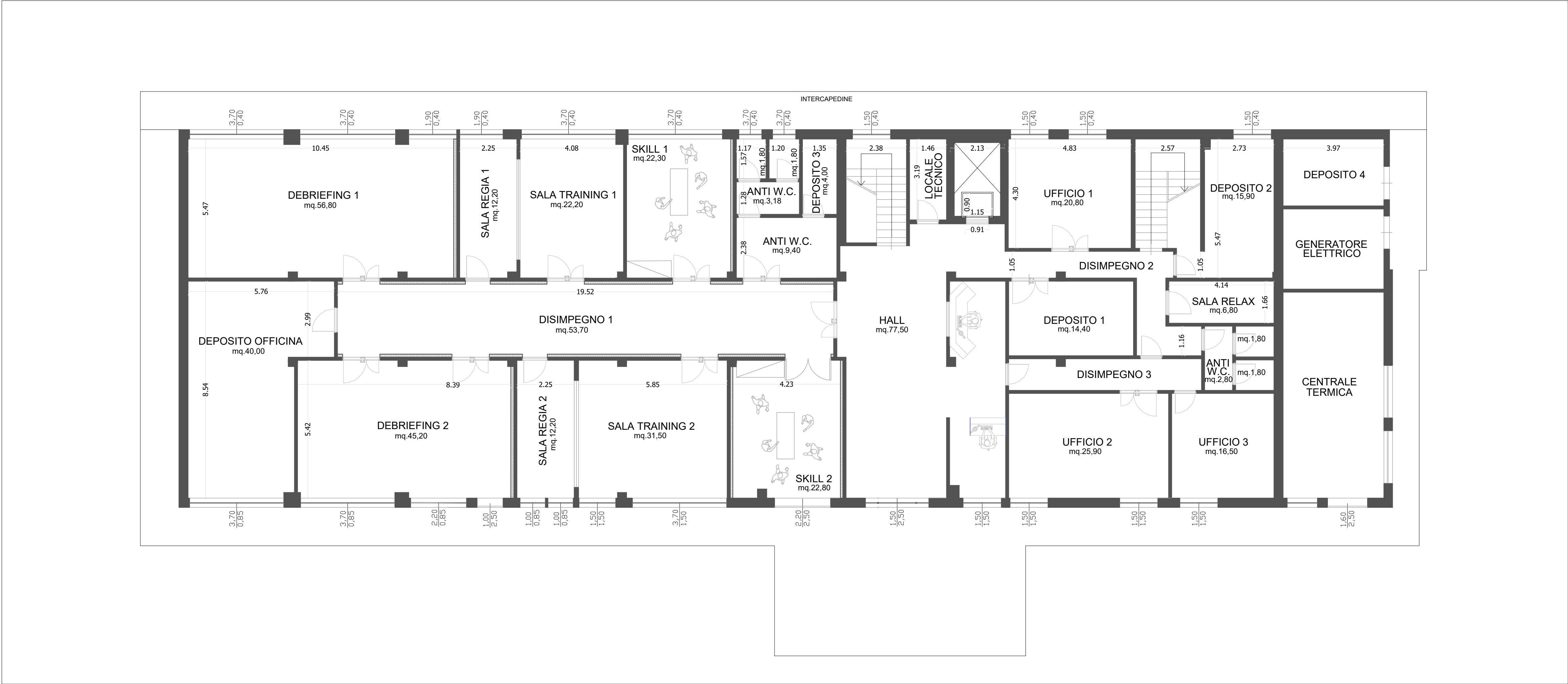
STATO DI PROGETTO - Piano terra Scala 1:100