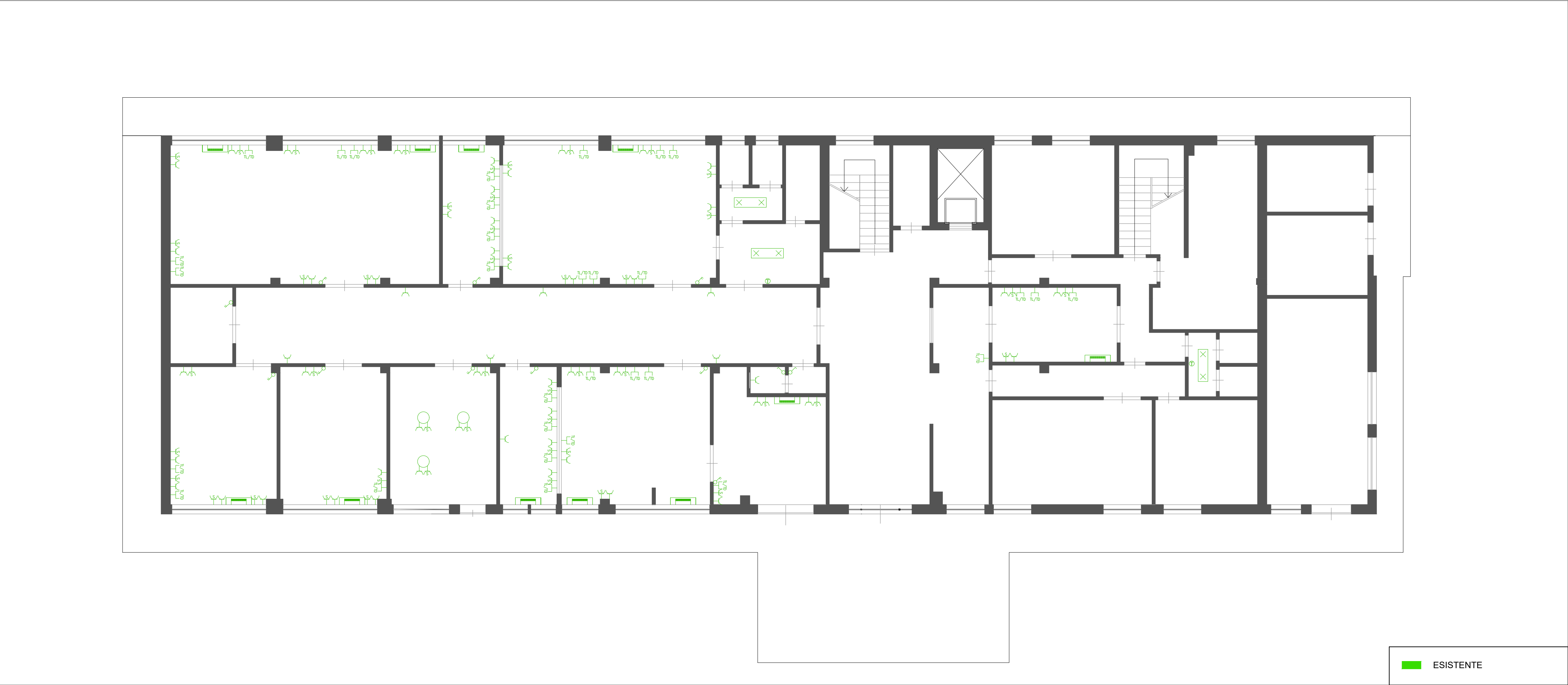
STATO DI FATTO - Piano terra Scala 1:100