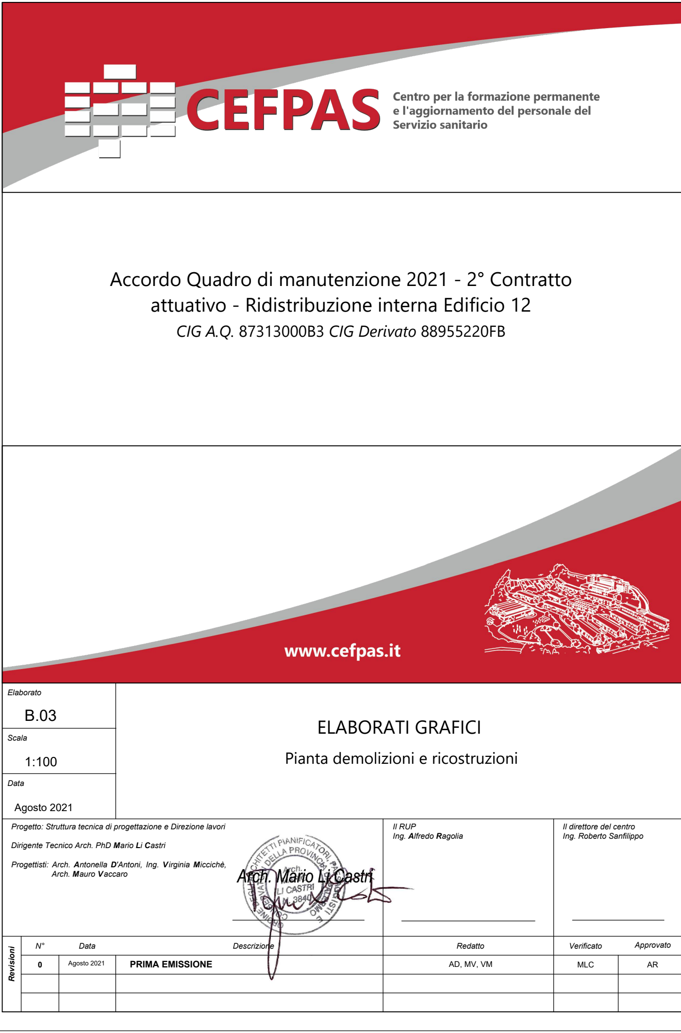
PIANTA DEMOLIZIONI E RICOSTRUZIONI - Piano primo Scala 1:100