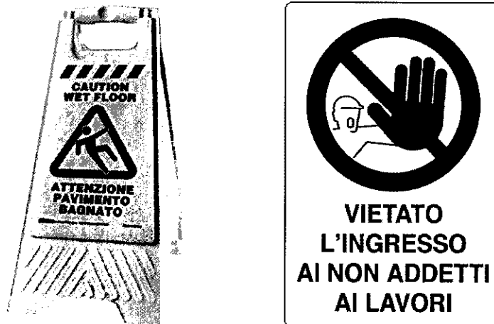
Figura 1: Segnaletica varia sistema atti alla delimitazione o alla segnalazione di luoghi di lavoro

Infine, è stato stimato il costo del lavoro, relativamente ai costi per la sicurezza da interferenze, per le attività di posa in opera degli apprestamenti previsti. Quest'ultimo è stato calcolato come l'11% del costo totale per gli apprestamenti necessari, così come previsto nel prezzario della Regione Sicilia, per l'incidenza mano d'opera per la posa in opera di segnaletica.