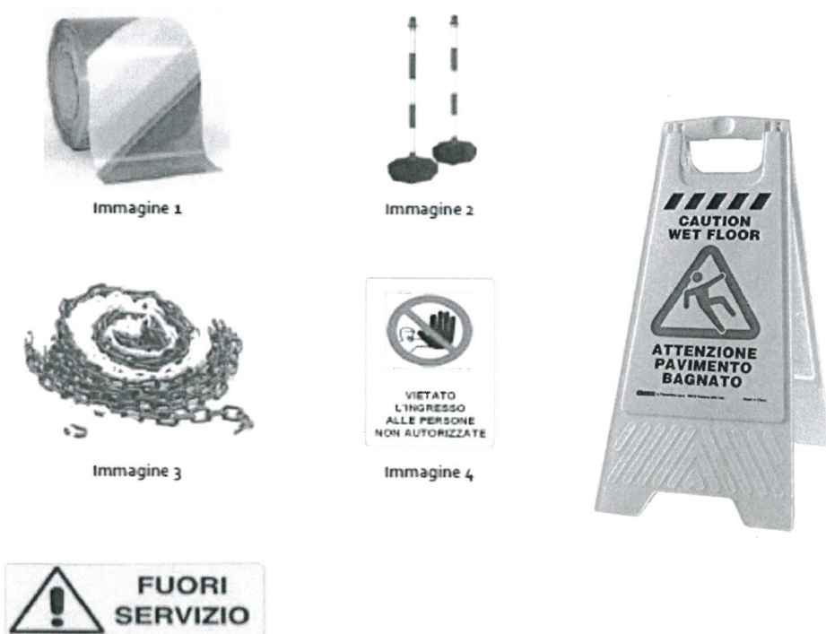
Figura 1: Segnaletica varia sistema atti alla delimitazione o alla segnalazione di luoghi di lavoro

Infine, è stato stimato il costo del lavoro, relativamente ai costi per la sicurezza da interferenze, per le attività di posa in opera degli apprestamenti previsti. Quest'ultimo è stato calcolato come l'11% del costo totale per gli apprestamenti necessari, così come previsto nel prezzario della Regione Sicilia, per l'incidenza mano d'opera per la posa in opera di segnaletica.