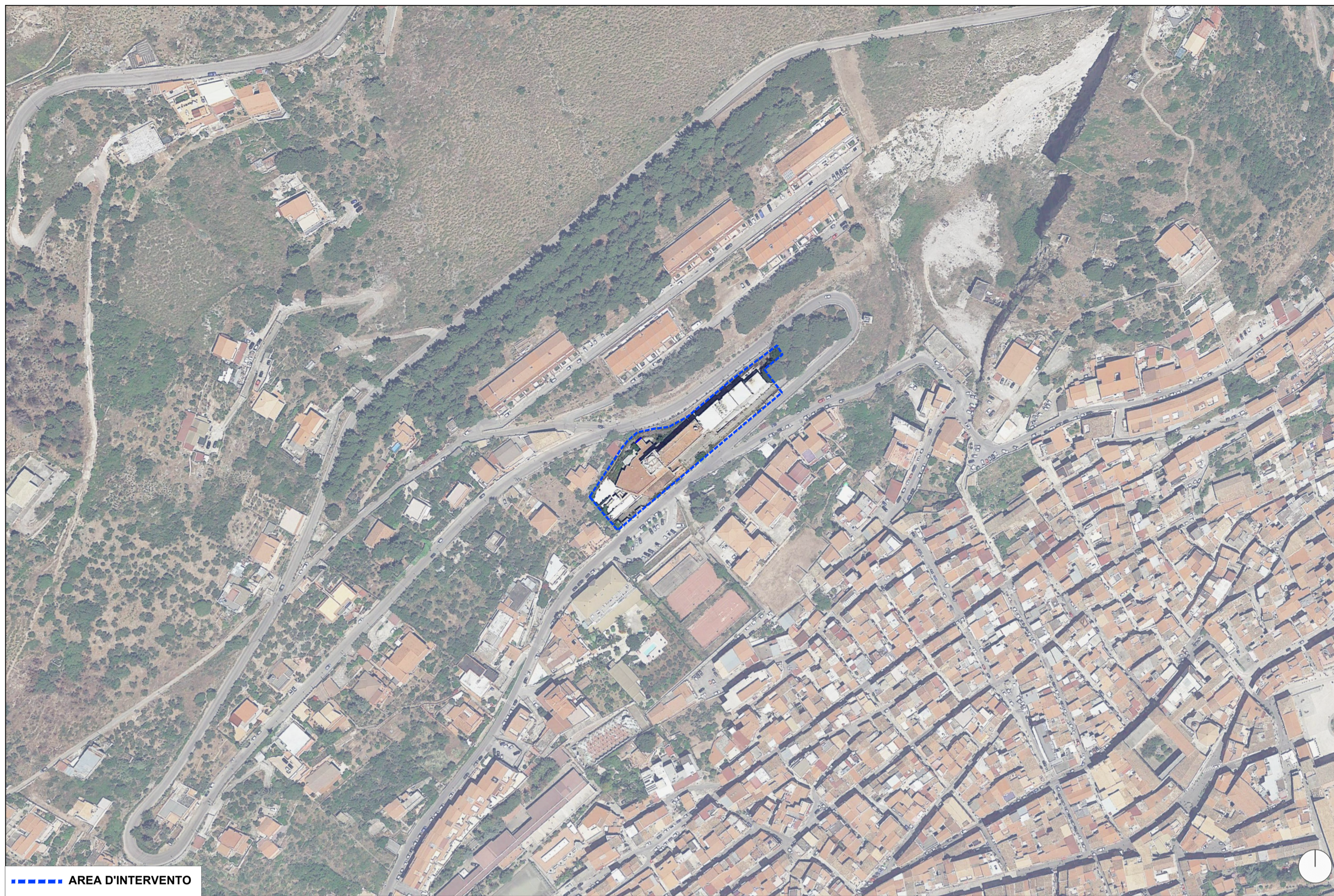
ORTOFOTO - Comune di Monreale (PA) - Fonte: Google Earth Scala 1:2.000