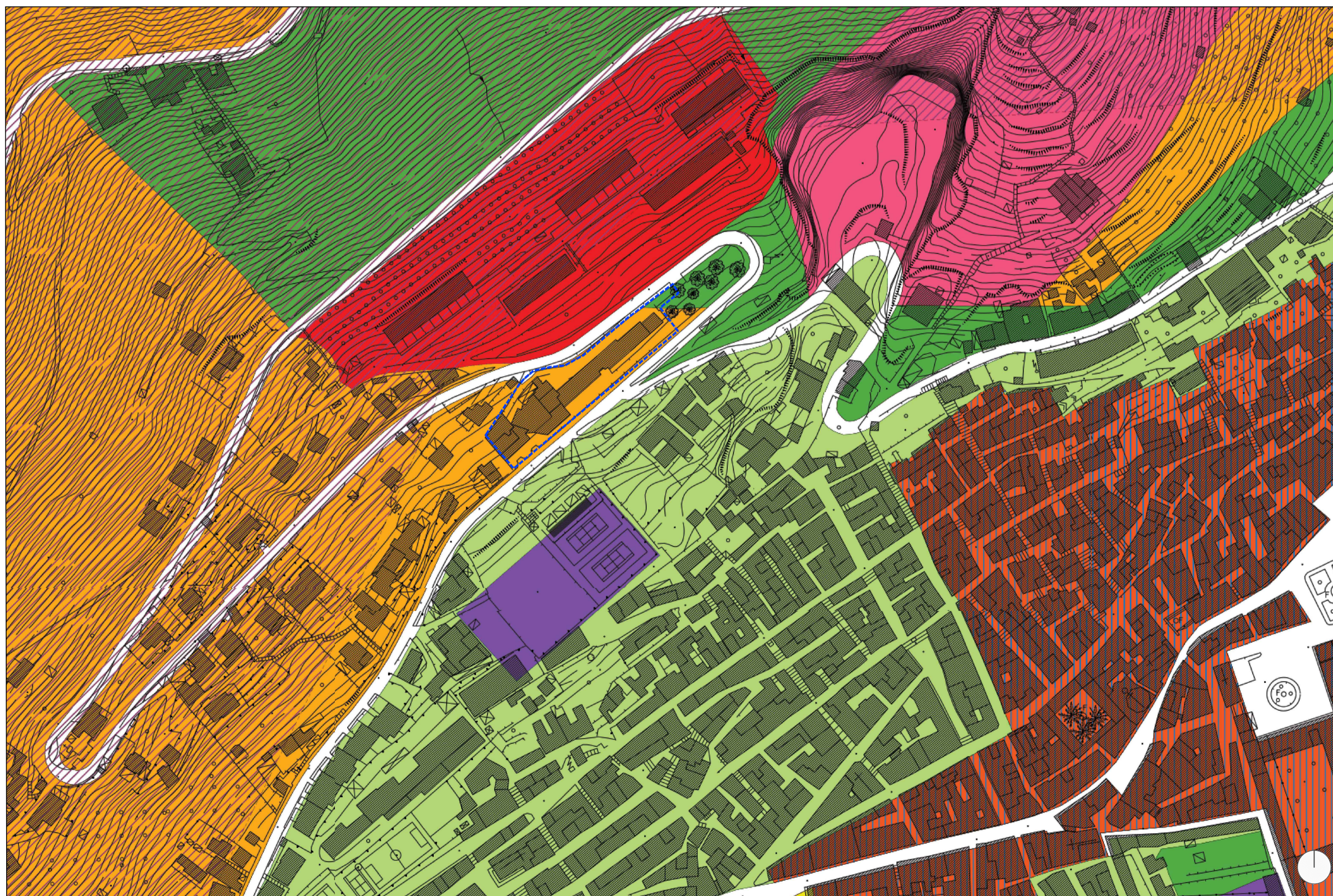
PIANO REGOLATORE GENERALE - Comune di Monreale (PA) - Fonte: www.portaleurbanistica.it/ Scala 1:2.000